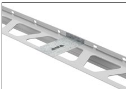
Izolace spojů na sraz se Schlüter®-BARA-HV