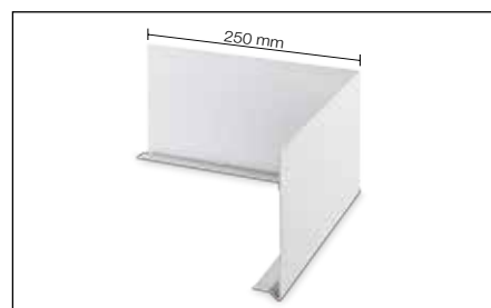
Vnější roh: Schlüter®-BARA-FAP/E 90°

Upozornění: Jako spojku doporučujeme překrýt spoje na sraz Schlüter®-BARA-STU.