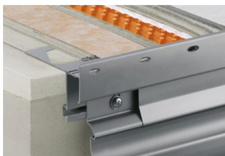
Skladba se Schlüter®-DITRA-DRAIN 8 a Schlüter®-BARA-RTKE