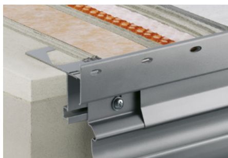
Skladba se Schlüter®-DITRA-DRAIN 4 a Schlüter®-BARA-RTKE