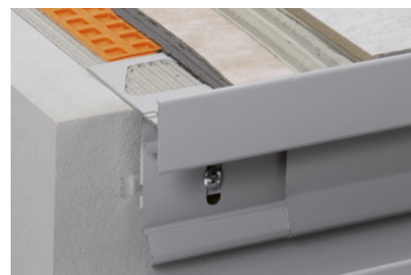
Skladba se Schlüter®-DITRA 25 a Schlüter®-BARA-RTKEG