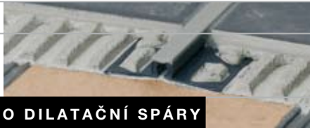
PROFIL PRO DILATAČNÍ SPÁRY