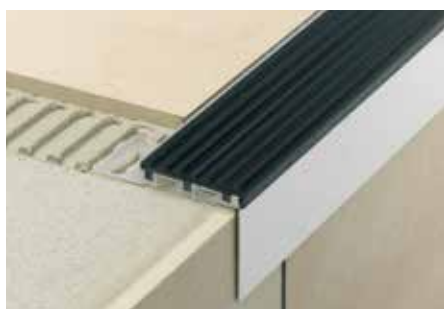
Schlüter®-TREP-B se Schlüter®-TREP-TAP