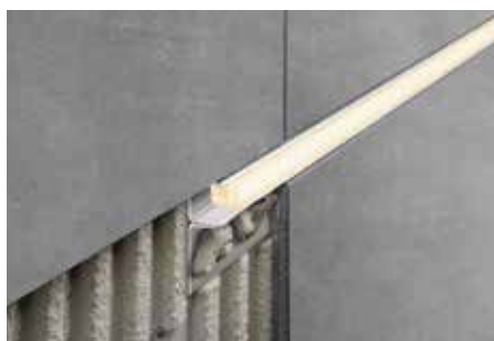
Osazení jako akcentní osvětlení s LED modulem LIPROTEC-LLPM

Proto je nutné maltu nebo spárovací materiál z pohledových ploch okamžitě odstranit a čerstvě položené obklady nezakrývat fólií. Profil je nutné uložit k obkladu celoplošně zcela do kontaktní vrstvy lepidla, aby se v dutinách nemohla hromadit voda.