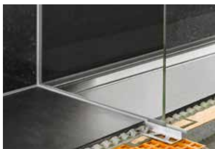
Osazení s prosklenou stěnou v oblasti sprchy