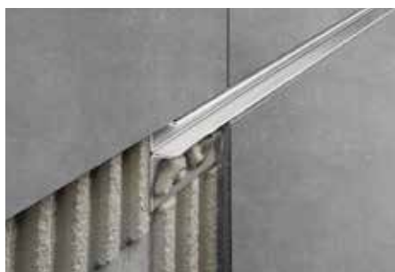
Osazení jako stínová spára v oblasti stěny