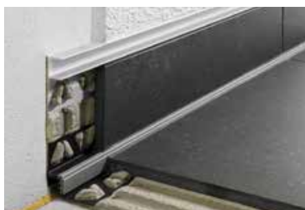
Osazení v oblasti soklu